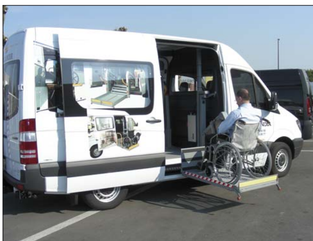
DH-P10 250 кг - Линеен лифт с 1 рамо