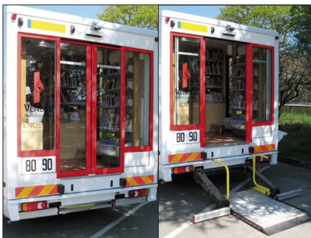
DH-SCH 500 кг - Компактен плъзгащ се лифт