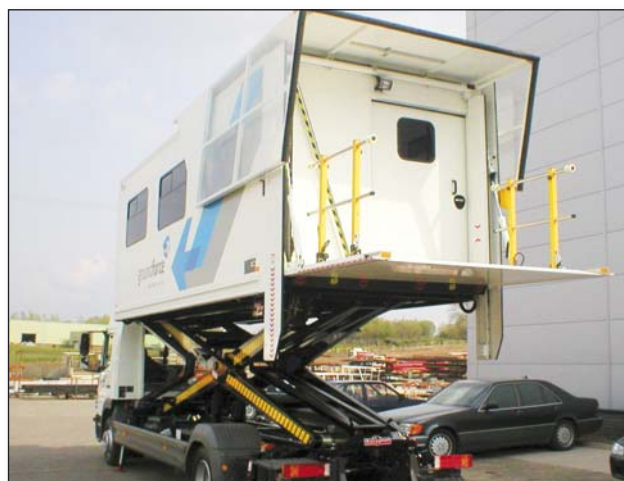
DH-V... 500-2000 кг - Разнообразие от колонни лифтове за пътници