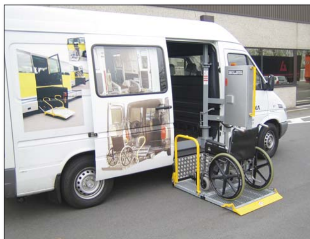
DH-VZH 350 кг - Пътнически колонен лифт