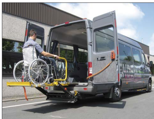
DH-CH 300 кг - Касетен плъзгащ се лифт