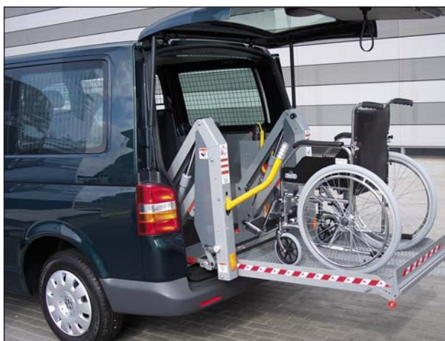
DH-P20 350 кг - Линеен лифт с 2 рамена